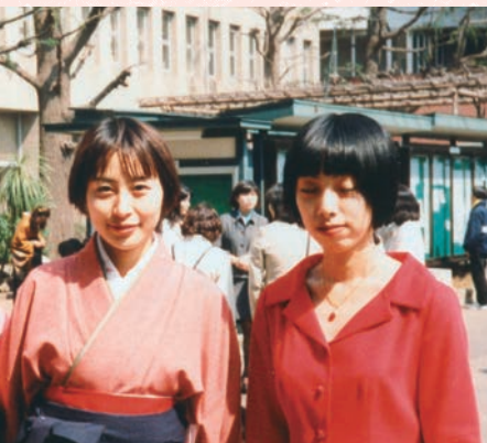
卒業式。脚本を書いていた劇団の主演女優の友人と。

が楽しく、それは小説にいきている気がしますね。その友達とは、今も親しくしています。小、中、高となかなか友達ができにくかったのですが、芸術学科は輪から外れがちのような個性的な人が多くて、居心地がよかったです。 ——作家生活はいかがですか？