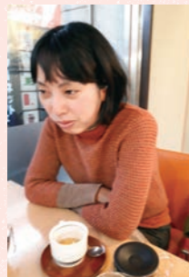
18年4月、高円寺にてインタビュー。

〈プロフィール〉 1976年1月5日生まれ。 1999年明治学院大学文学部芸術学科卒業 2006年に「風化する女」で文学界新人賞を受賞。08年「月食の日」で第139回、17年「雪子さんの足音」で第158回芥川賞候補となる。そのほかの著書に『イギリス海岸 イーハトーヴ短篇集』『夜の隅のアトリエ』『まっぶたつの先生』などがある。