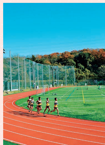
写真は現役学生の練習風景です。

宮から伊勢神宮までの118km（8区間）のコースで行われ、大学陸上部の8名のランナーが母校の襷をつなぎ、快走致しました。成績は出場20校中19位（7時間13分22秒）という結果でしたが、記念すべき第1回大会に出場したという証しは、明治学院の歴史に大きな足跡を残しました。