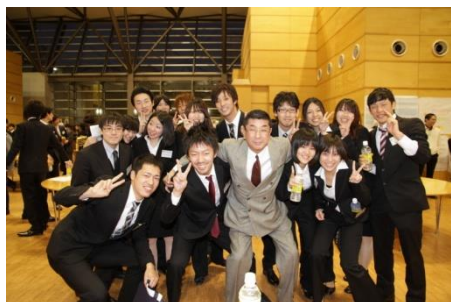
同窓生を囲む現役学生たち