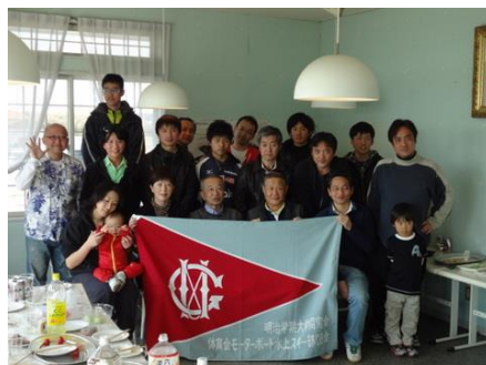
モーターボート水上スキー部OB会