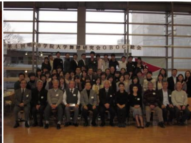
舞踏研究会 OBOG 総会