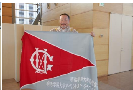
アーベントスキークラブ OB 会