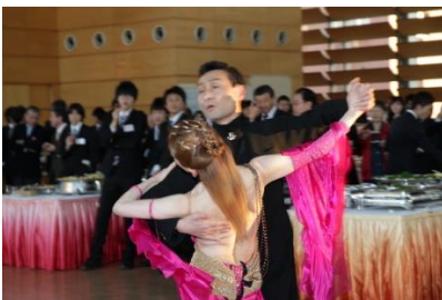
ダンスのデモンストレーション