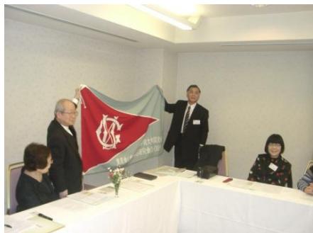
童友会(児童問題研究会 OB・OG 会)