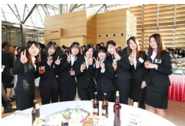
今年は 260 名の学生諸君が出席