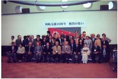
川崎支部再立ち上げ 10 周年