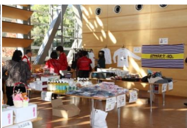
同窓生からの献品によるバザー