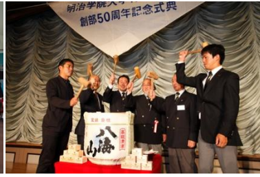
ヨット部 50 周年