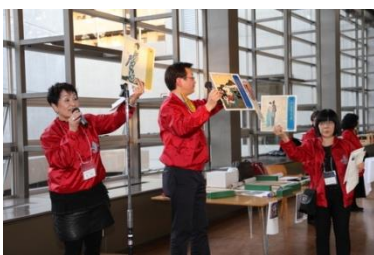
今年もやりましたオークション