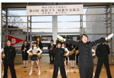
毎年恒例の応援団による演技