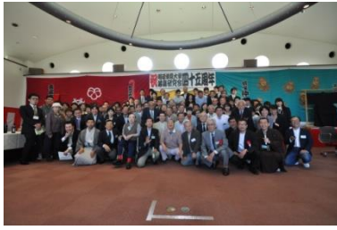
落語研究会 45 周年