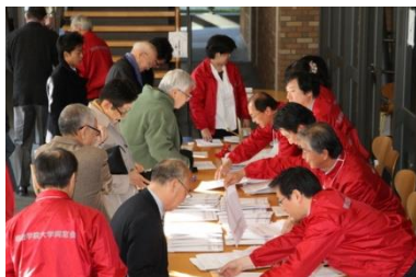
続々と詰めかける同窓生