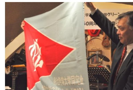
グリーン・リーヴス OB 会