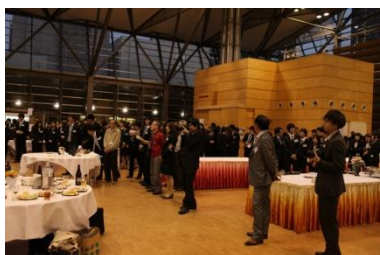
多くの参加者でにぎわう交流会