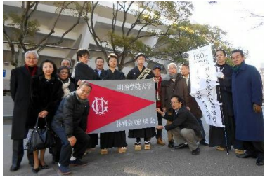
應援團京都徒步行軍