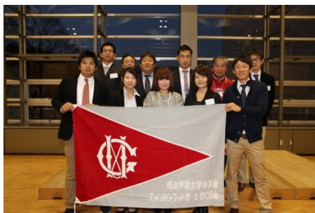
アメリカンフットボール部 OB 会