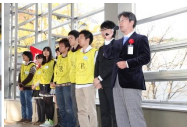
ボランティアセンター活動報告