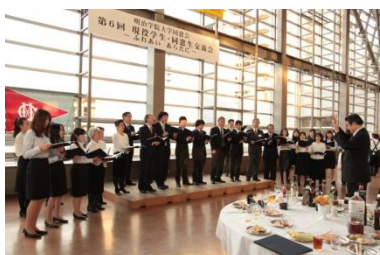
グリークラブ OBOG の熱唱